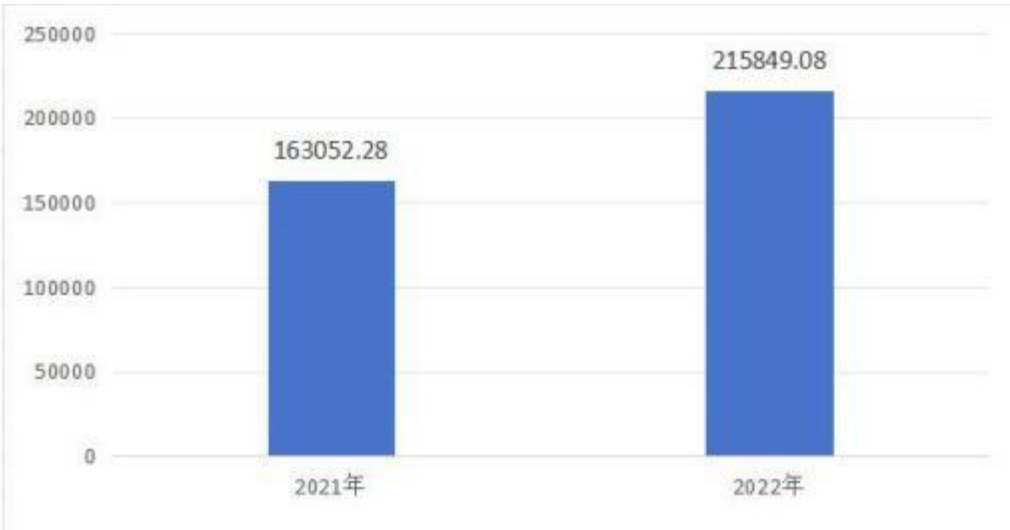
图 4：财政拨款收、支决算总计变动情况

2022 年度一般公共预算财政拨款支出 146,449.03 万元，占本年支出合计的 67.85%。与 2021 年度相比，一般公共预算财政拨款支出减少 6,376.74 万元，下降 4%。主要原因是区政府对交通基础设施建设投入中一般公共预算财政拨款支出减少。