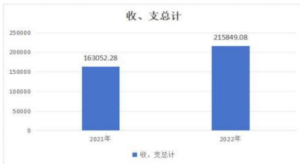
图 1：收、支决算总计变动情况

2022 年度收、支总计 215849.08 万元，与 2021 年度相比，收、支总计各增加 52796.8 万元，增长 32.38%，主要原因是其他地方自行试点项目收益专项债券收入安排的支出项目：奥特莱斯物流基础设施项目、川龙大道改建工程、轨道交通装备智造园(轨道交通数字经济产业园)、府河北路、航空大道与机场二通道互通、航城西路、航空新城基础设施工程(进出城 5 条路)、(S115 孝天公路)等项目收入支出增加。