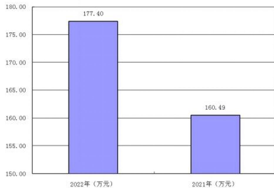
图 4：财政拨款收、支决算总计变动情况