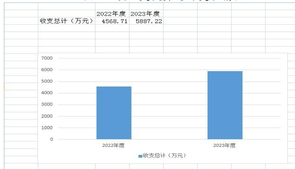
图 1：收、支决算总计变动情况

2023 年度收、支总计均为 5887.22 万元。与 2022 年度相比，收、支总计各增加 1318.51 万元，增长 22.4 %，主要原因是一般公共预算财政拨款比 2022 年增加，疫情结束事业收入比 2022 年有增长，故 2023 年度收支总增长。